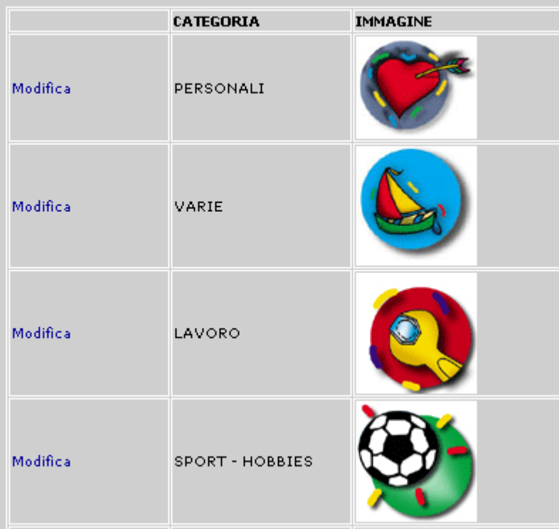
GESTIONE TABELLA CATEGORIA- ELENCO